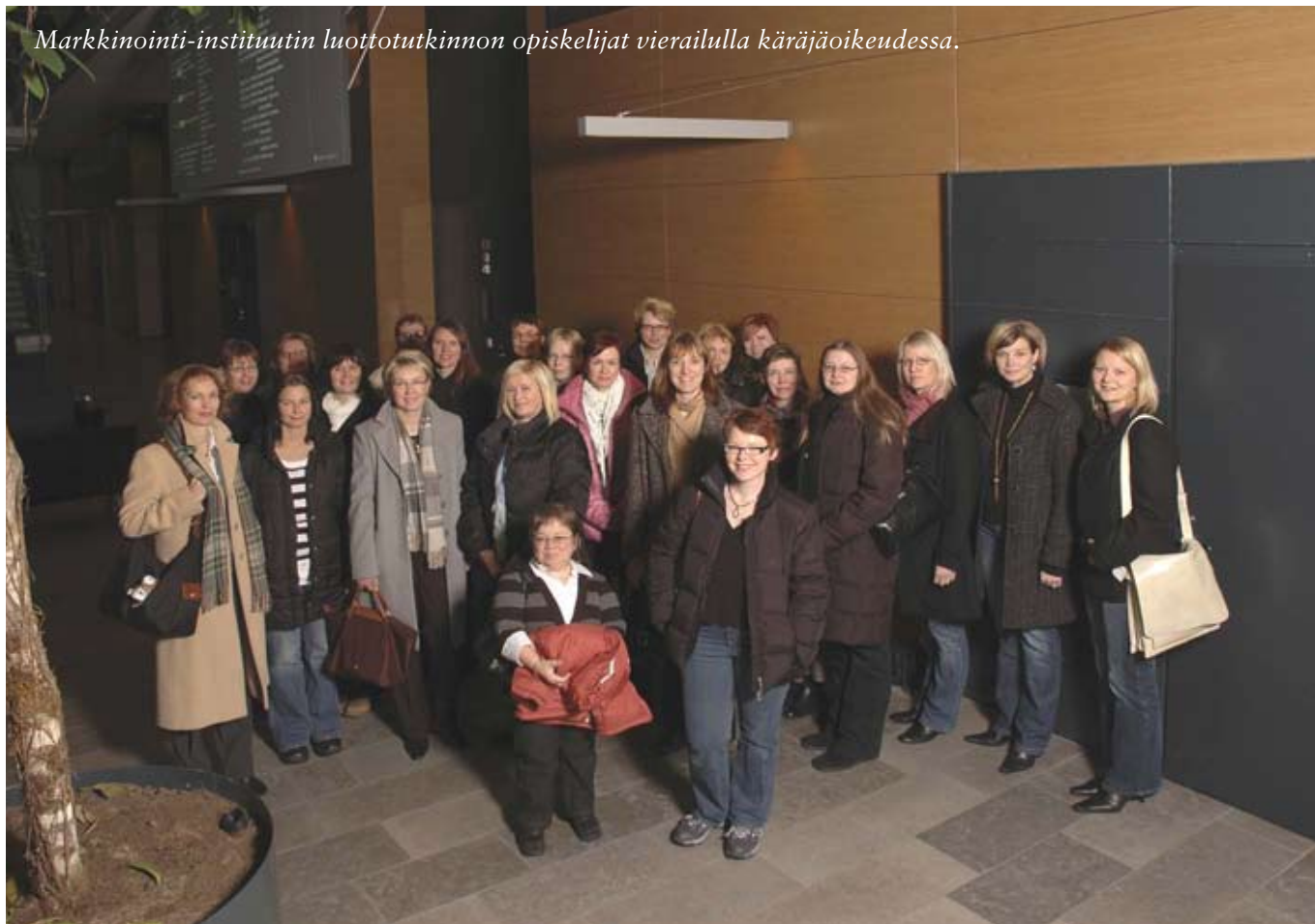
Markkinointi-instituutin luottotutkinnon opiskelijat vierailulla käräjäoikeudessa.

Enää ei pelkkä asiaosaaminen riitä, vaan kaikissa tehtävissä tarvitaan monipuolisia viestintätaitoja. Esimerkiksi talousosaston informaatio sekä talouden luvut ja niiden merkitys pitää ilmaista havainnollisesti ja