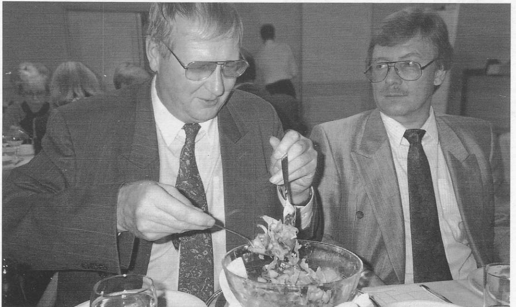
Kokous päättyi miellyttävästi yhteisen iltapalan merkeissä