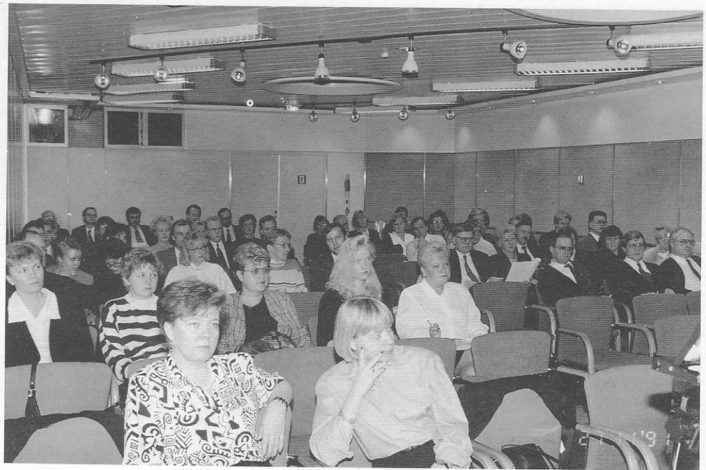
Meriseminaarin tarkkaavaista kuulijakuntaa